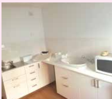
Exemple de Nursery Marthe et Marie (colocation de Paris)