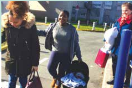
2 colocataires sont allées chercher la jeune maman à la maternité, pour accueillir son nourrisson. Bienvenue chez toi petit ange !

Les colocations solidaires de la Maison de Marthe et Marie proposent une alternative unique aux structures sociales publiques, avec un accueil dès le début de la grossesse, un logement stable, de petite taille, dans lequel une ambiance familiale et bienveillante permet l'apaisement des jeunes mamans. Elles y sont entourées, couvertes d'affection, mais ne sont pas complètement prises en charge : elles restent actrices de leur autonomie, motivées par l'exemple que donnent les volontaires, et soutenues par les responsables d'antenne. C'est l'intégration par le haut !