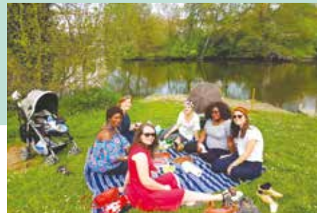
C'est le printemps, la coloc' de Nantes organise une sortie au parc. Moment bucolique avec bébés, femmes enceintes et volontaires !