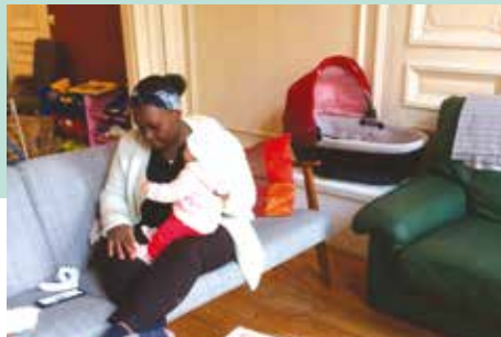
La coloc' de Lille prend ses marques dans la nouvelle maison : les murs s'égayent, le séjour se réchauffe, c'est la VIE !