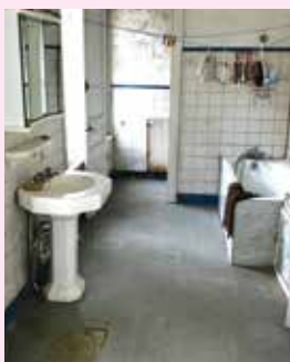
La buanderie actuelle

Les deux salles de douche présentes dans la maison ne sont pas suffisantes. Nous souhaitons ré-aménager une ancienne buanderie en "Nursery", bénéficiant des équipements suivants : baignoire bébé à hauteur de plan de travail, table à langer, sol non glissant, chauffage, fenêtre sécurisée.